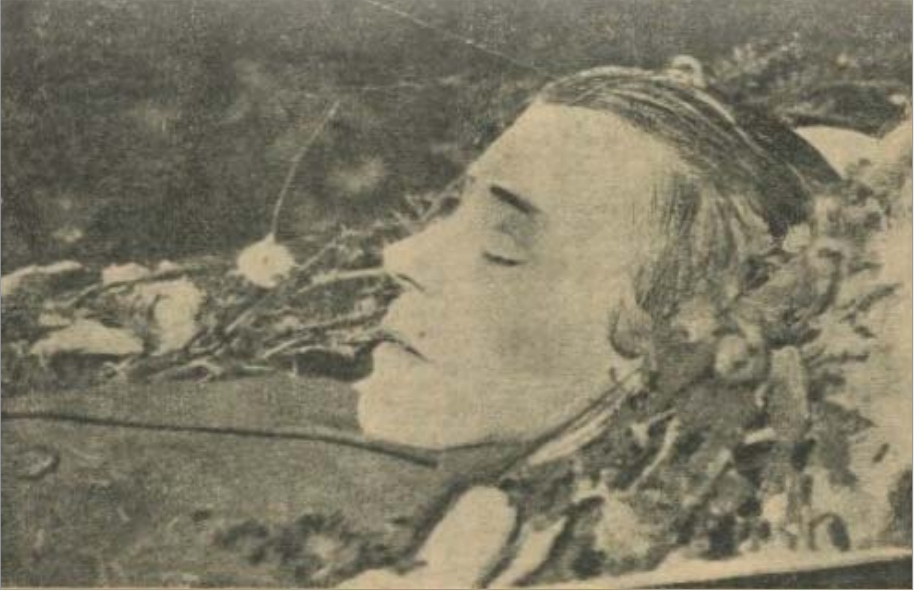
С. Есенин в гробу